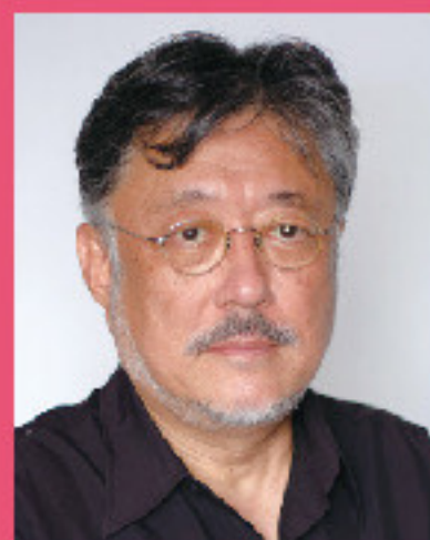
松本修 Osamu Matsumoto

演出家、俳優。1955年、札幌市生まれ。文学座の俳優を経て、1989年に演劇集団MODEを設立。チャーホフ、ペケット、ワイルダー等の海外戯曲を独自のワークショップを用いて再読、再構成する。2000年代はカフカの小説を多数舞台化。紀伊國屋演劇賞個人賞、千田是也賞、読売演劇賞優秀演出家賞、同優秀作品賞などを受賞。この3月をもって近畿大学文芸学部教授を退任。MODEを再起動させる。