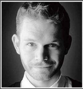
音楽 マイケル・クーマン