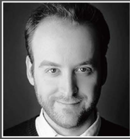
脚本・詞 クリストファー・ダイヤモンド

今、大注目のミュージカル・クリエイター、マイケル・クーマンとクリストファー・ダイヤモンドが創り出し、ニューヨークやロンドンを筆頭に様々な地域やプロダクションで繰り返し上演されている『HOMEMADE FUSION』が遂に日本上陸!!