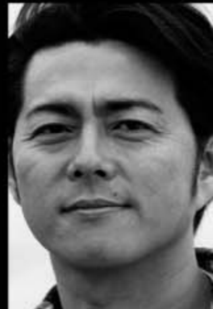
スタンレー・コワルスキ