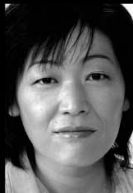
黒人女／メキシコ女／看護婦