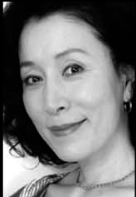
ブランチ・デュボア