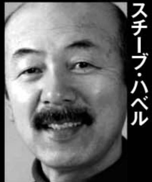
スチーブ・ハベル